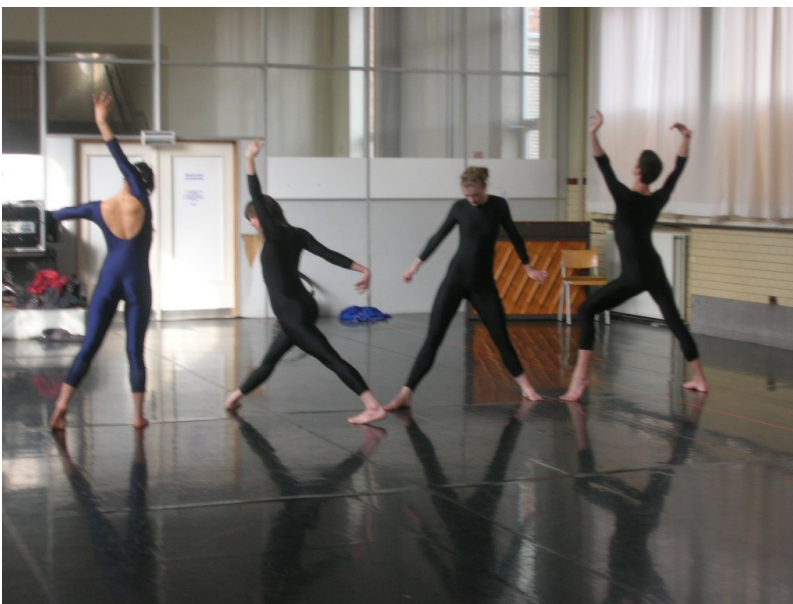
Répétition de Stretchquartet