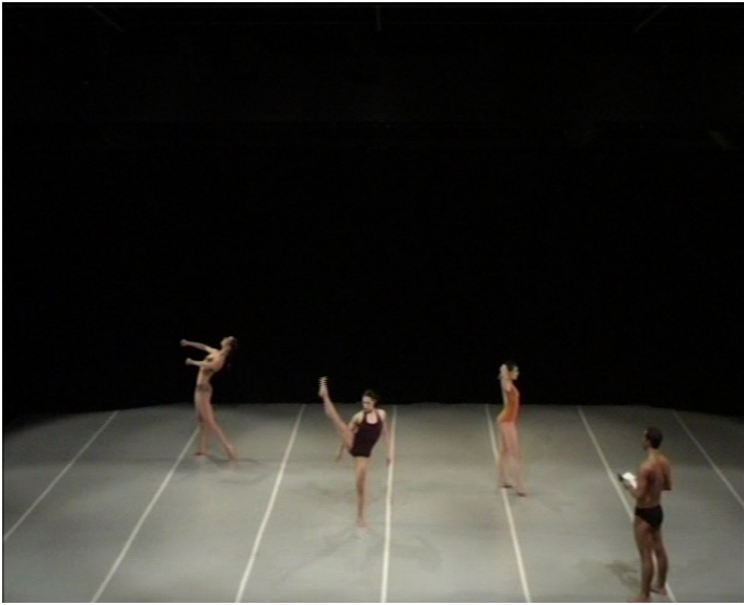
Scène 'Maestro' de la chorégraphie Amis